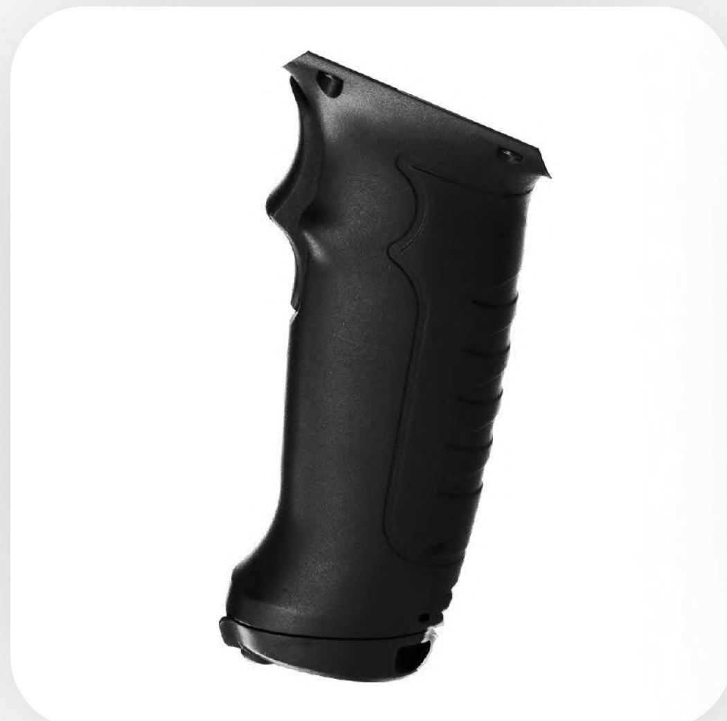
Пистолетная рукоять позволяет упростить работу и увеличить ее темп