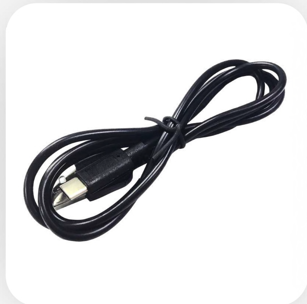
Кабель USB - Type-C