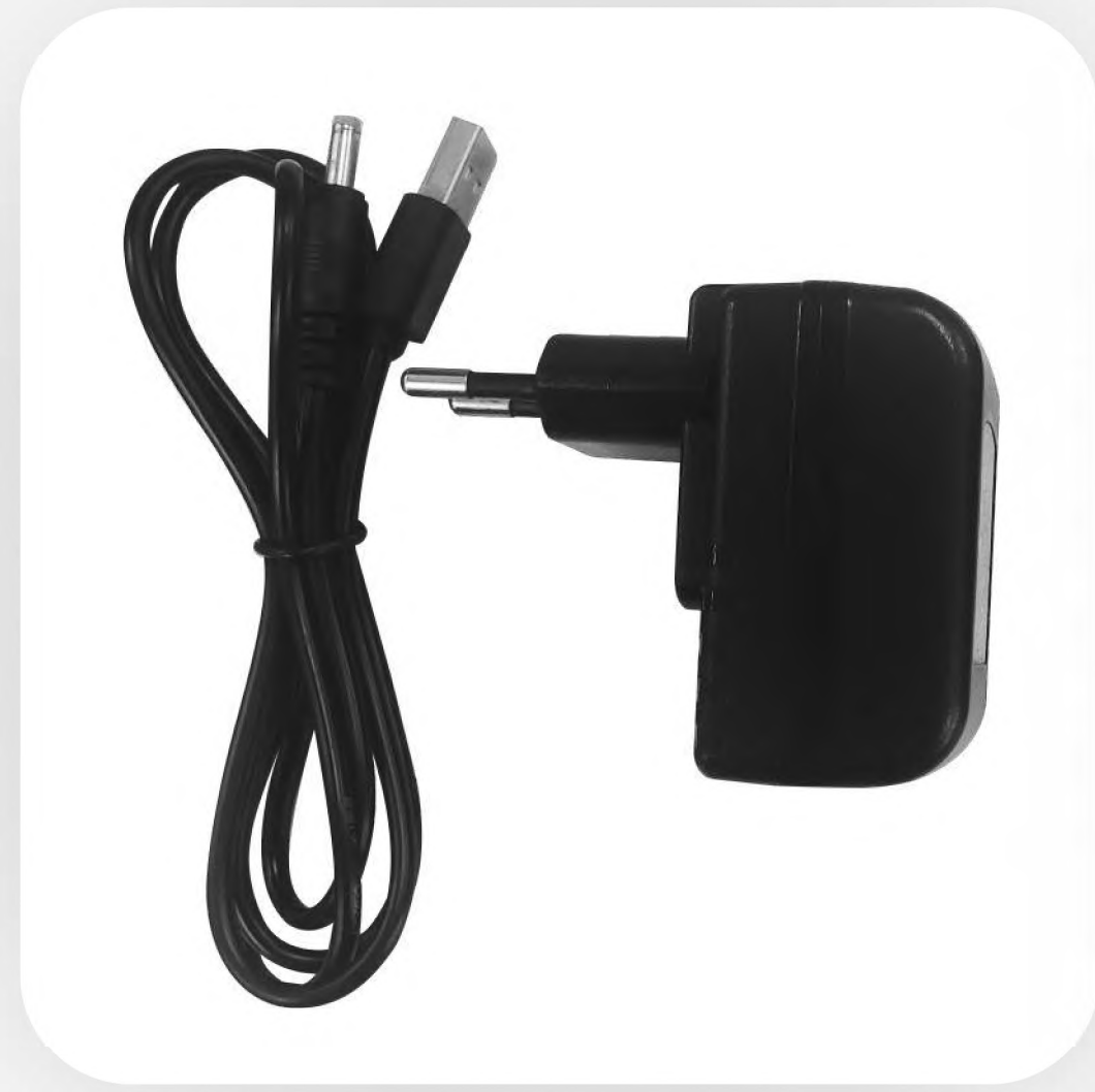
Адаптер питания с выходным напряжением 5В/2А