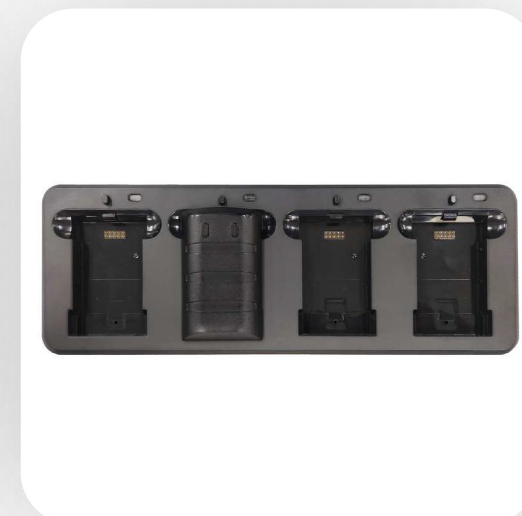
Зарядная подставка для АКБ (4-слотовая)