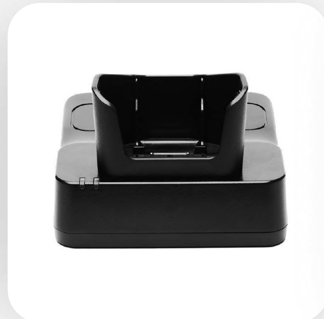
Зарядная станция. 1 слот для ТСД