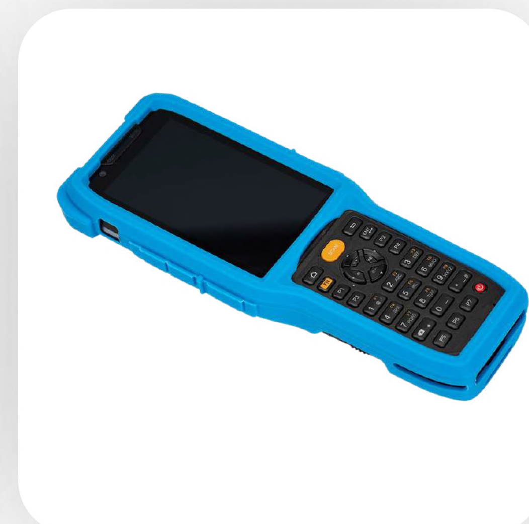
Бампер для защиты