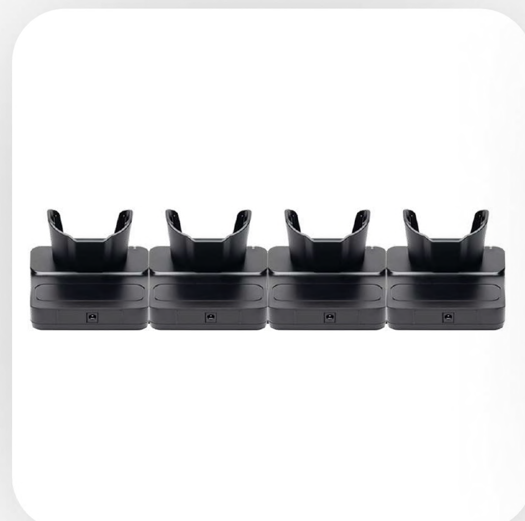
Зарядная подставка для терминала (4-слотовая)