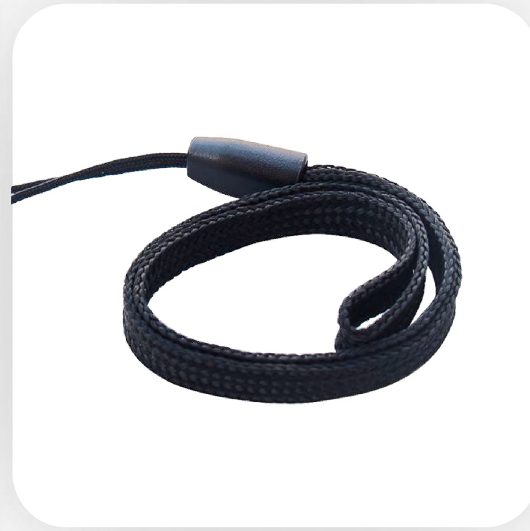
Ремешок на руку легко закрепить и снять. Повышает эргономику работы с ТСД.