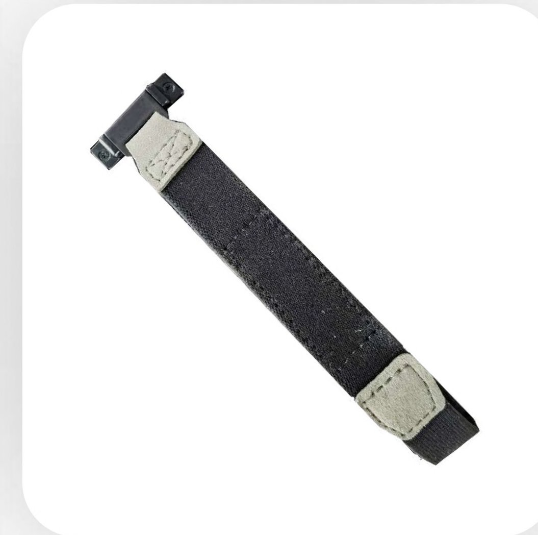
Ремешок на заднюю часть корпуса